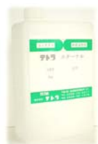
1 kg ポリ入