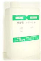
1 kg 角ポリ入